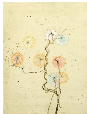
© Mireille Gros Estampe : Vernis mou sur Chine collé