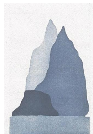
© Sébastien Strahm Estampe à l'aquatinte