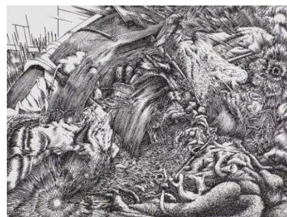
© Markus Raetz Estampe au burin